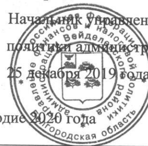
График проведения ревизий и проверок на первое полугодие 2020 года