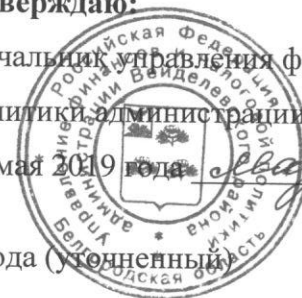
График проведения ревизий и проверок на первое полугодие 2019 года (утвержденный)