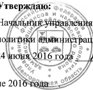
График проведения ревизий и проверок на второе полугодие 2016 года