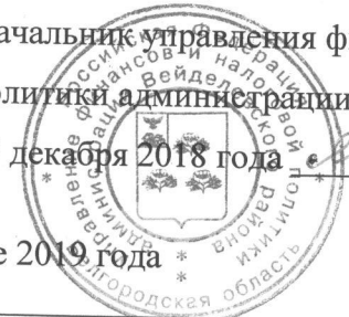
График проведения ревизий и проверок на первое полугодие 2019 года